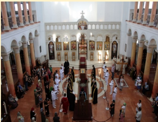
ხატის მოგზაურობა - ფოთის ეპარქია