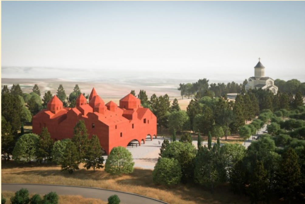
მუზეუმი, ექსტერიერის ხედი