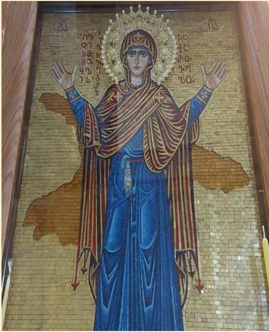
ხატი - „ღვთისმშობლის წილხვედრი საქართველო“