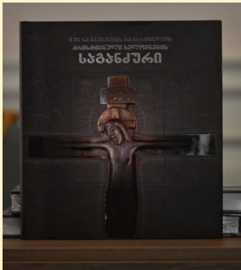
წიგნი „ შუა საუკუნეების საქართველოს ქრისტიანული ხელოვნების საგანძური“