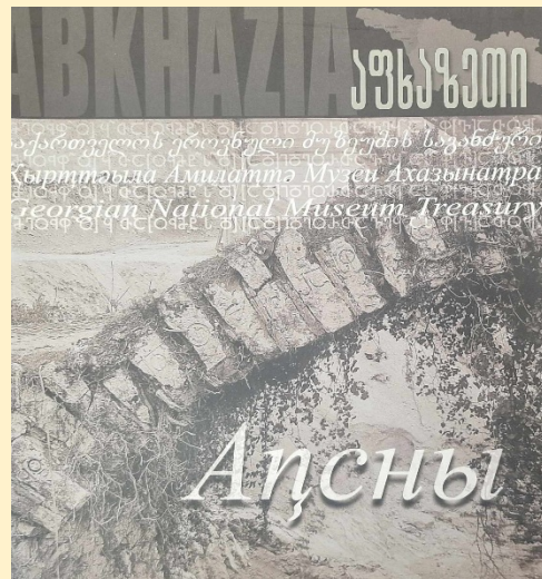
წიგნი „აფხაზეთი“ საქართველოს ეროვნული მუზეუმის საგანძური