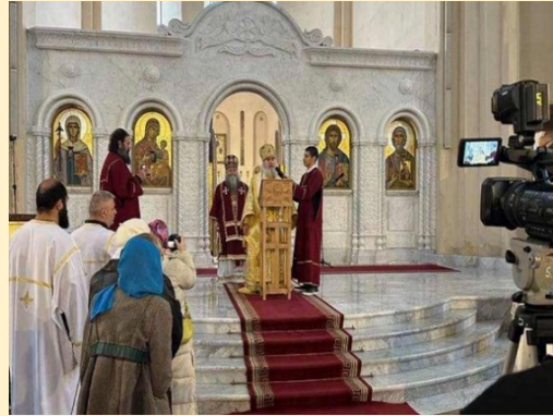
სადღესასწაულო წირვა ღვთისმშობლის ტაძარში მახათას მთაზე