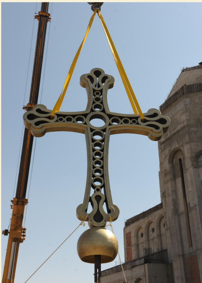
ღვთისმშობლის ტაძრის ჯვარი

ტაძრის თავზე აღმართულია 5,1 მ, ხოლო კარიბჭის თავზე 2,5 მ სიმაღლის თითბერისგან ჩამოსხმული ჯვარი.