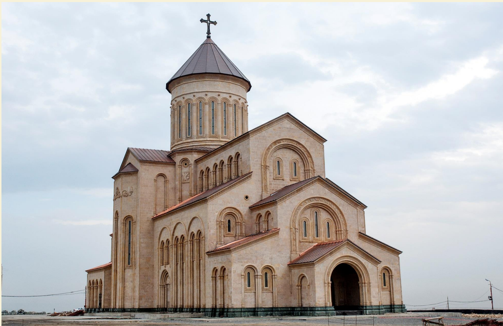
მახათას მთაზე მშენებარე ივერიის ღვთისმშობლის ხატის სახელობის ტაძარი ავტორი: ომარ ნაფეტვარიძე