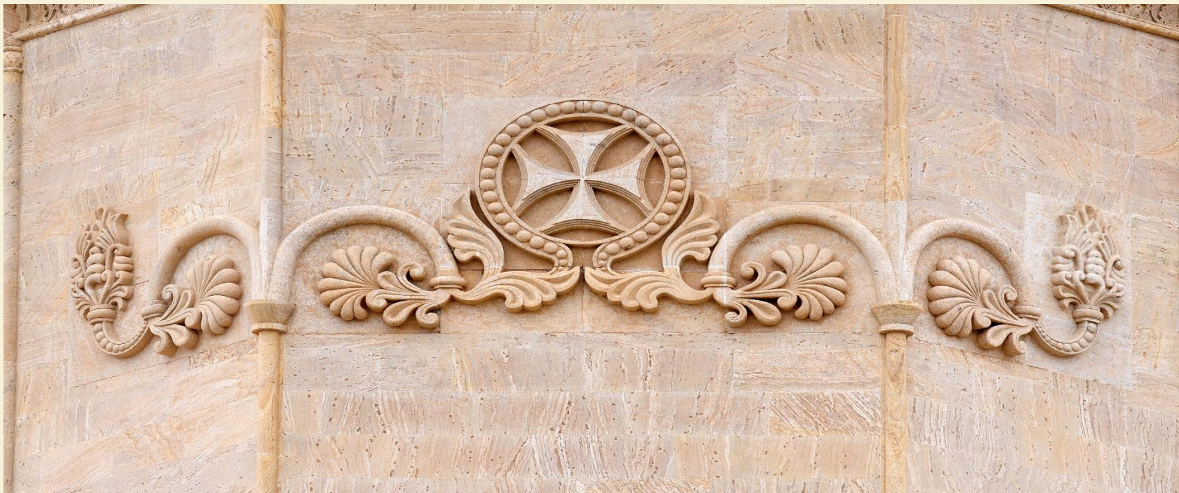
დეკორატიული ელემენტი -აყვავებული ჯვარი

2017 წელს „საზოგადოება ივერიისა“-ს მიერ შპს „ყაზტრანსგაზ“-თან გაფორმებული ხელშეკრულებით განხორციელდა ტაძრამდე გაზის საქალაქო ქსელის მიყვანის სამუშაოები. მიმდინარეობს მოლაპარაკება კომპანია „ჯორჯიან უოთერ ენდ ფაუერ“- თან ტაძრის ტერიტორიამდე პროექტით გათვალისწინებული წყალსადენისა და საკანალიზაციო საქალაქო ქსელების მოწყობასთან დაკავშირებით.