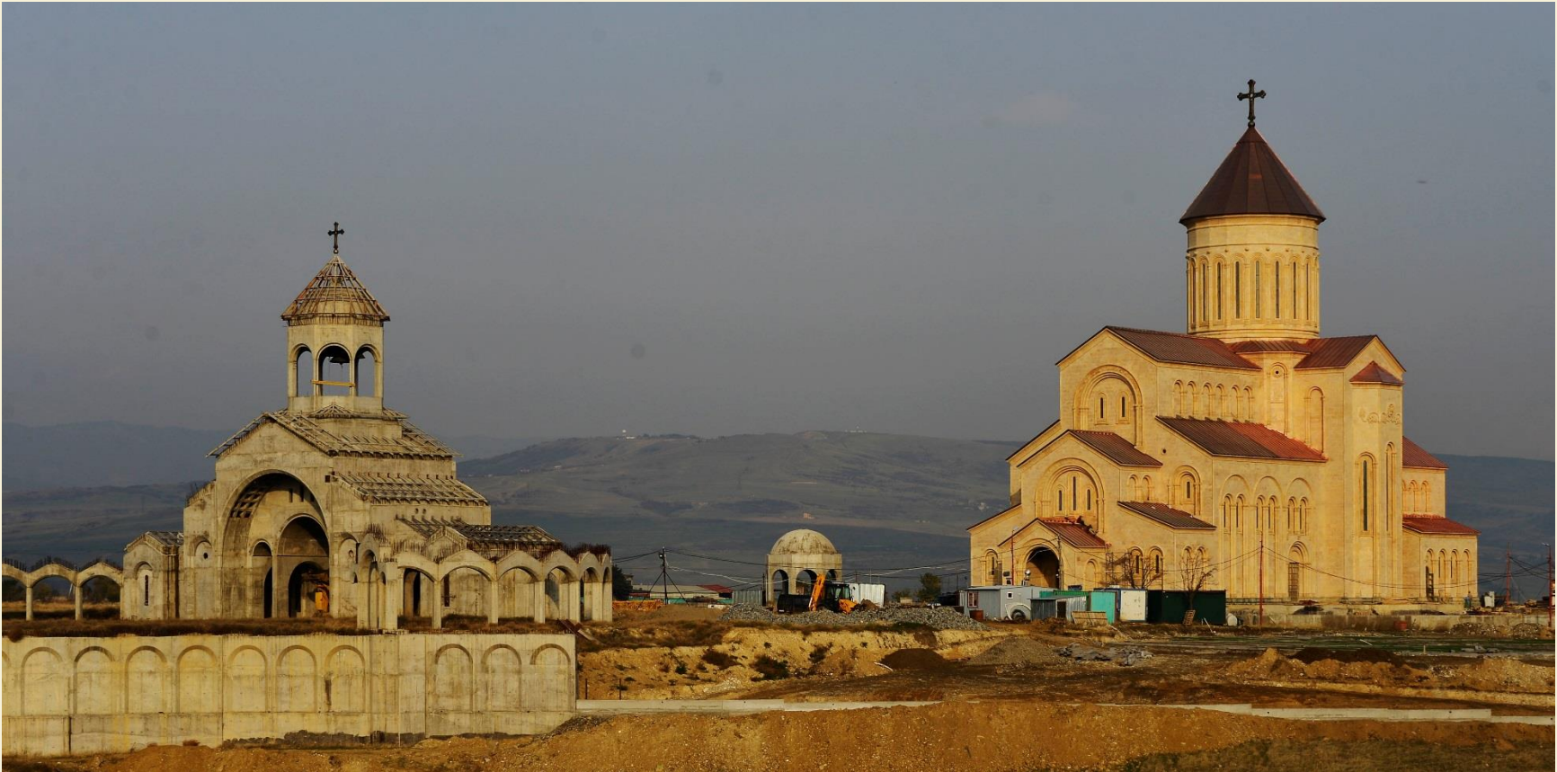
მახათას მთაზე მშენებარე ივერიის ღვთისმშობლის ხატის სახელობის სამონასტრო კომპლექსი

2017 წელს დასრულდა ტაძრის ძირითადი შენობის, წყალკურთხევის პავილიონის, თითქმის ყველა დამხმარე ნაგებობის (რკინაბეტონის გვირაბი, დიდი საყრდენი კედელი, საქვაბე, საზოგადოებრივი საპირფარეშო, ჩილერების მოედანი, ტაძრის გამმიჯნავი დიდი საყრდენი კედელი, გადასასვლელი ხიდით, ტაძრის გარშემოსავლელი საყრდენი კედლის და რკინაბეტონის ფილის დიდი ნაწილი), კარიბჭის სამრეკლოთი და კოლონადის რკინაბეტონის კარკასების მშენებლობა.