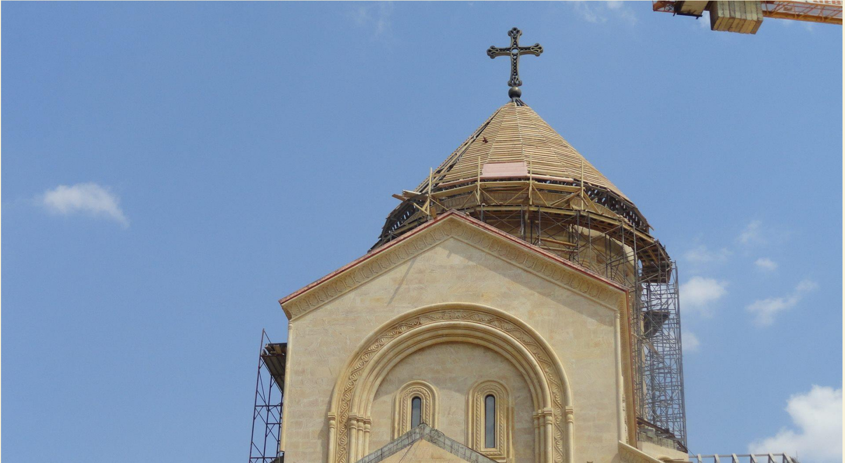
სპილენძის სახურავის მოწყობის სამუშაოები

2017 წლის ბოლოსთვის მთლიანად დასრულდა ტაძრის სპილენძის სახურავის მოწყობის სამუშაოები. სახურავში მოეწყო გადახურვების თბოიზოლაცია ქვაბამბით. ტაძრის სხვენში ასასვლელად დამონტაჟდა ლითონის ოთხი 12-მეტრიანი კიბე.